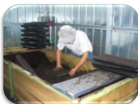
Figura 1 Título breve y descriptivo en cursiva

Nota. Operario llenando semilleros o bandejas con turba. SENA (2018).