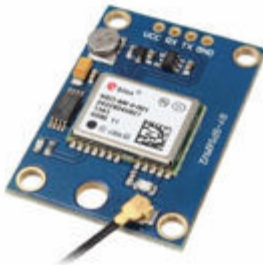
Figura 3 ; Módulo GPS NEO 6M

GPS NEO 6M : Sistema de Posicionamiento Global el cual permite la ubicación de la motocicleta la programación empleada se base en la obtención de datos de coordenadas los cuales son emitidos por este dispositivo que serán enviados al módulo GSM para el envío de información al usuario .