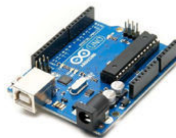
Figura 1 ; Arduino Uno

Arduino Uno: es un microcontrolador de código abierto el cual permite leer entradas y Convertirlas en salidas, contiene su propio lenguaje de programación basado en el cableado y el software Arduino (IDE). Lo usamos en nuestro sistema para controlar los dispositivos como el de GPS y Gsm .