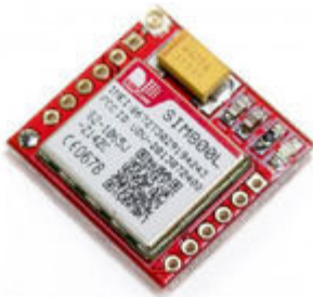
Figura 2 ; Modulo GSM SIM800L

GPS NEO 6M : Sistema de Posicionamiento Global el cual permite la ubicación de la motocicleta la programación empleada se base en la obtención de datos de coordenadas los cuales son emitidos por este dispositivo que serán enviados al módulo GSM para el envío de información al usuario .