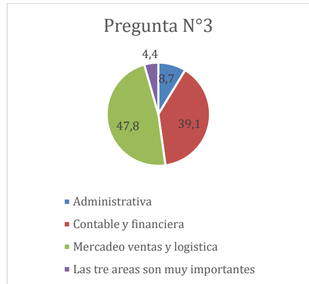
Figura 3. Grafica circular.

A la pregunta sobre las áreas que consideran más importantes de asesorar el 47,8% se inclina por Mercadeo, ventas y logística y el 39,1% por contable y financiera lo que significa que estas áreas resultan como prioritarias a la hora de establecer un portafolio de servicios en un consultorio empresarial.