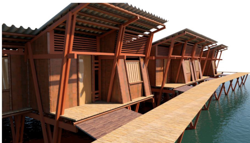
Figura 2. Emplazamiento urbano

En la Figura 2 se plantea la propuesta barrial y el modelo de ocupación para el sector de “Playa arrecha” en el municipio de San Andrés de Tumaco, Nariño, una solución de vivienda para este municipio debe ser pensada desde la escala barrial, ya que culturalmente es un modo habitacional constituido desde lo comunitario y familiar, la propuesta pretende el desarrollo de 238 unidades habitacionales con aproximadamente 1190 habitantes potenciando las actividades en colectivo con una respuesta de generación de espacio público en razón de 15,8 m 2 por habitante, así mismo la relación mar- manglar- hábitat como reconocimiento de la dinámica adaptativa de una cultura al entorno; se valora y se establece la recuperación de zonas eco-sistémicas endógenas, el mar como fuente de conexión ancestral aprovechado mediante el uso de muelles y barreras naturales que permitan mitigar la condición de riesgo de las zonas costeras. “La norma, en el espacio público, debe permitir lo fugaz, lo efímero, lo que permanece en movimiento; no puede ser una norma excluyente ni jerarquizadora, pues nadie puede ser excluido de la experiencia de lo público” (Noguera, 2004).