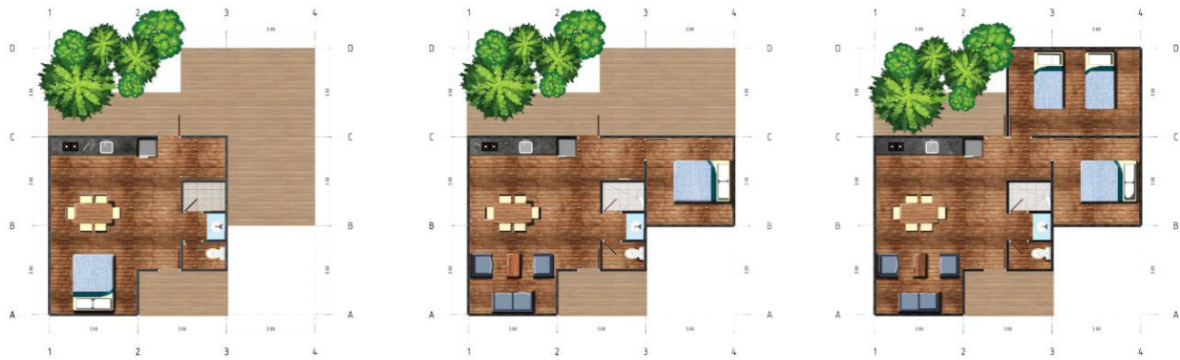
Figura 3. Plantas arquitectónicas tipo.

Como se puede evidenciar en la Figura 3 la unidad de vivienda es un espacio dinámico donde se reconocen los diferentes cambios de usos de acuerdo a las necesidades de la familia, se registra el “porche” como espacialidad transicional y extensión de las actividades sociales con un trasfondo barrial, un gran espacio recibe el acceso, el cual puede transformarse en zona social (Sala- comedor) o zona de descanso (Habitación), el baño partiendo de la composición de familia extensa se establece compartimentado permitiendo el uso simultáneo, la cocina como culturalmente ha sido localizada, se encuentra en la parte final relacionada con el patio y este a su vez con el exterior y patios de otras unidades, es este espacio el que permite al igual que el “porche” las relaciones interbarriales. La zona privada (habitaciones) se encuentra protegida del espacio de recibimiento para generar intimidad y protección de la zona social. “Para nosotros la casa tiene que ser un espacio muy amplio sobre todo la sala de la casa si, tiene que ser un lugar muy amplio porque como la familia es, tan grande y la relación campo poblado se mantiene todavía, entonces cuando la familia llega tiene que haber un lugar donde acomodarlos sí, no necesariamente estamos hablando de habitaciones, estamos hablando de la sala, además porque la sala es el lugar donde todos y todas nos encontramos para chismorrear” (Participante 2, comunicación personal, 25 de mayo 2017).