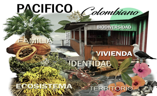
Figura 1. Collage marco conceptual