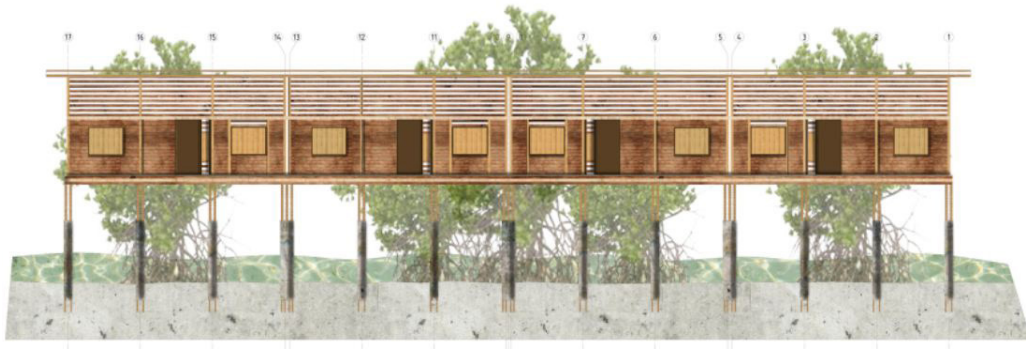
Figura 4. Fachada frontal.