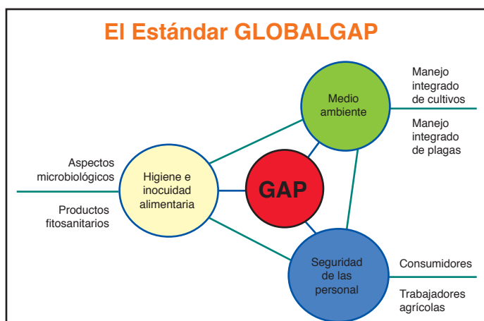
Figura 2. El Estándar GLOBALG.A.P.

En la Figura 2 se presenta de manera gráfica dichos sustentos, donde se evidenció la importancia de la integración y articulación de los mismos en su aplicación. Pérez, (2014).